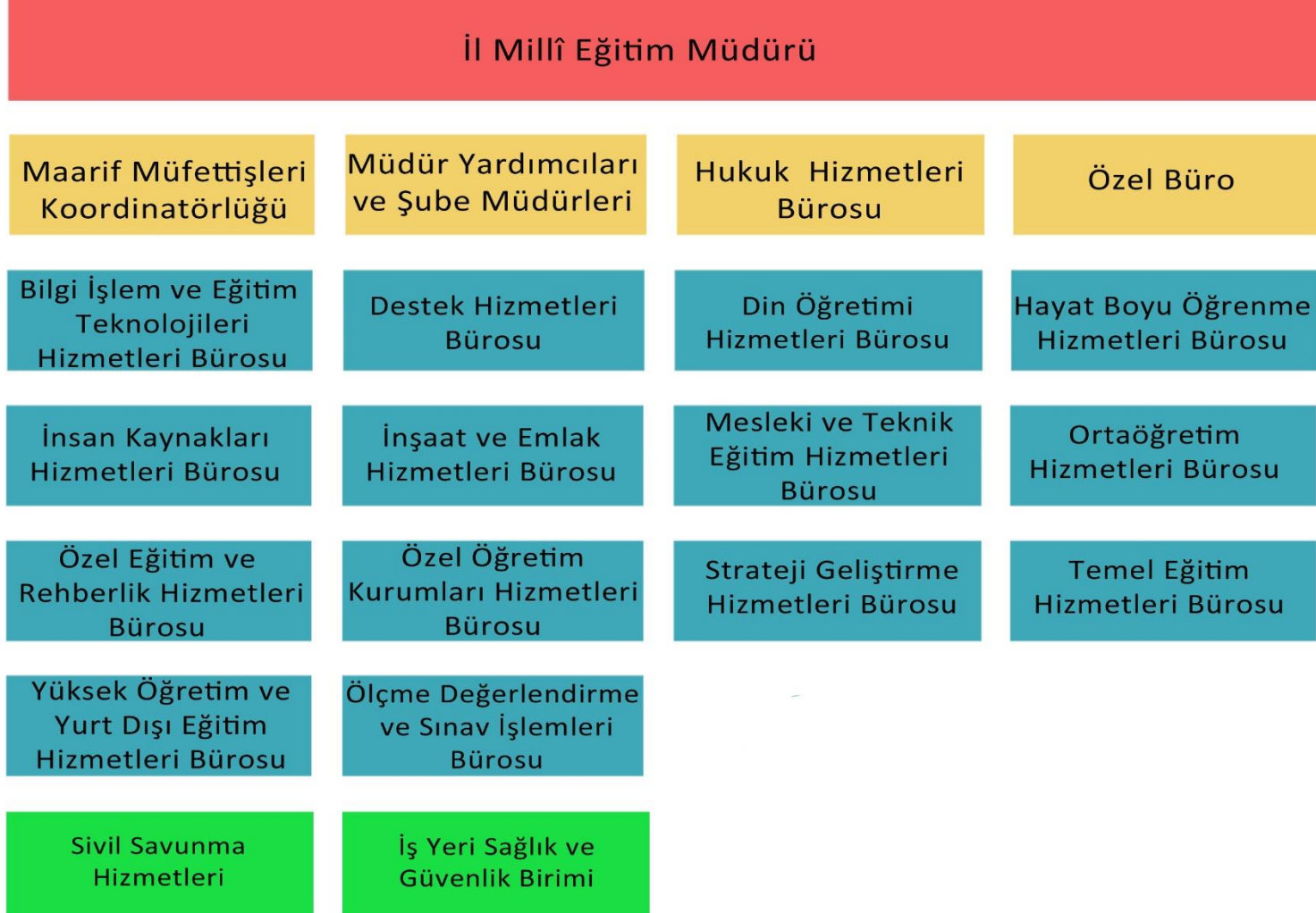
Şekil 5: Teşkilat Yapısı