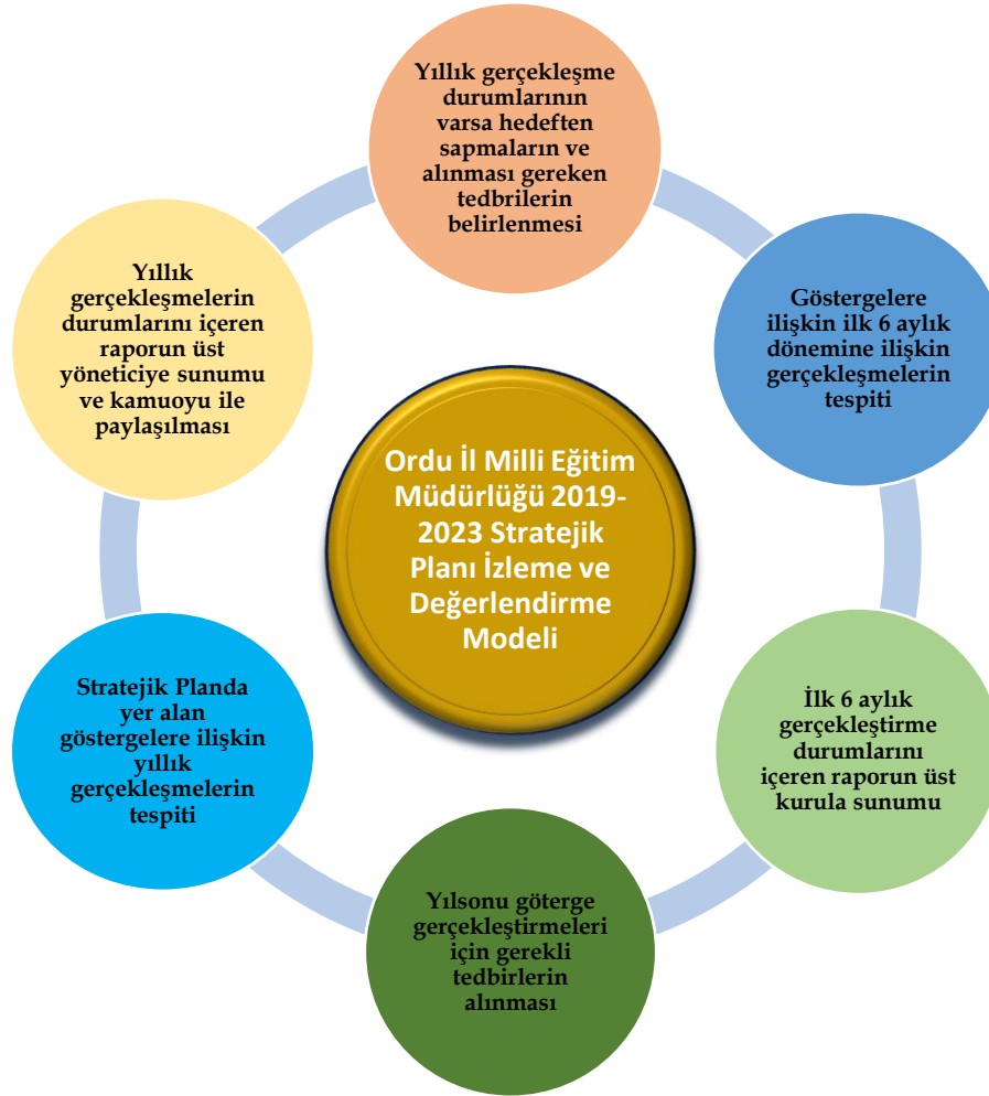
Şekil 6: İzleme ve Değerlendirme Süreci

Ordu İl Millî Eğitim Müdürlüğü 2019-2023 Stratejik Planında yer alan performans göstergelerinin gerçekleştirme durumlarının tespiti yılda iki kez yapılacaktır. Ara izleme olarak nitelendirilebilecek yılın ilk altı aylık önemini kapsayan birinci izleme kapsamında, Stratejik Plan İzleme ve Değerlendirme Modeli vasıtasıyla, Strateji Geliştirme Kurulu tarafından harcama birimlerinden sorumlu oldukları performans göstergeleri ve stratejiler ile ilgili gerçekleştirme durumlarına ilişkin veriler toplanarak raporlanacaktır. Performans hedeflerinin gerçekleştirme durumları hakkında hazırlanan "stratejik plan izleme raporu" Ordu İl Millî Eğitim Müdürü, müdür yardımcıları, birim amirleri ve kurum içi paydaşların görüşüne sunulacaktır. Bu aşamada amaç, varsa öncelikle yıllık hedefler olmak üzere, hedeflere ulaşılmasının önündeki engelleri ve riskleri belirlemek ve yıllık hedeflere ulaşılmasını sağlamak üzere gerekli görülebilecek tedbirlerin alınmasıdır.